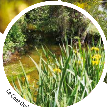
Le Coat Quévéran à Saint-Hernin