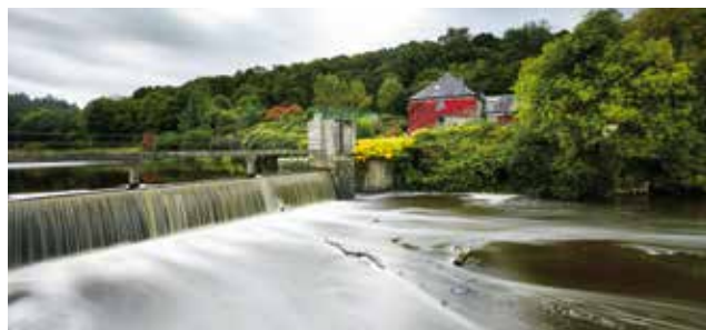
L'Hyères canalisée à Stervallen

Son rôle est maintenu dans les différentes missions en lien direct avec la prévention des crues : élaboration des Plans de Prévention des Risques d'inondation (PPRI), prévision des crues et alerte (SPC), contrôle de la sécurité des ouvrages hydrauliques et de la bonne mise en œuvre des actions GEMAPI (autorisations administratives), police de l'eau.