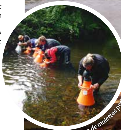
Comptage de mulettes perlières