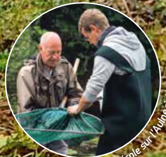
Suivi piscicole sur l'Aulne rivière