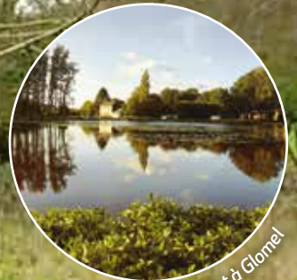
Le Kergoat à Glomel