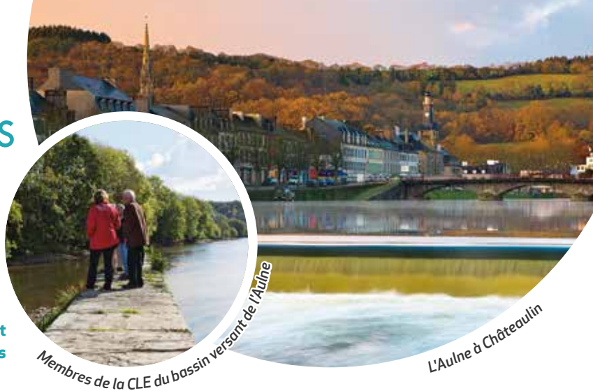
Membres de la CLE du bassin versant de l'Aulne