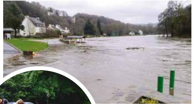
Inondations de décembre 2013 à Châteauneuf-du-Faou