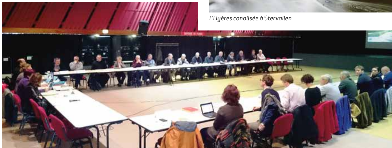
Réunion de la CLE du SAGE