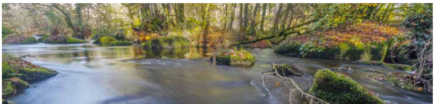
L'Ellez à Loqueffret

La compétence GEMAPI découle à la fois de la Directive européenne Cadre sur l'Eau (DCE), qui fixe des objectifs pour la préservation et la restauration des eaux superficielles et souterraines, et de la Directive Inondation (DI), traduites en droit français par les lois Grenelle successives (2009 et 2010).