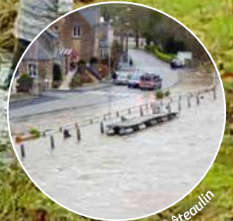
Crue à Châteaulin