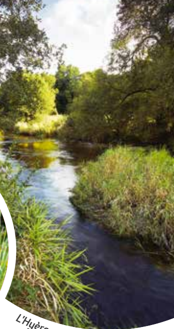
L'Hyères dans les Côtes d'Armor