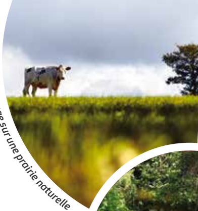
Pâturage sur une prairie naturelle